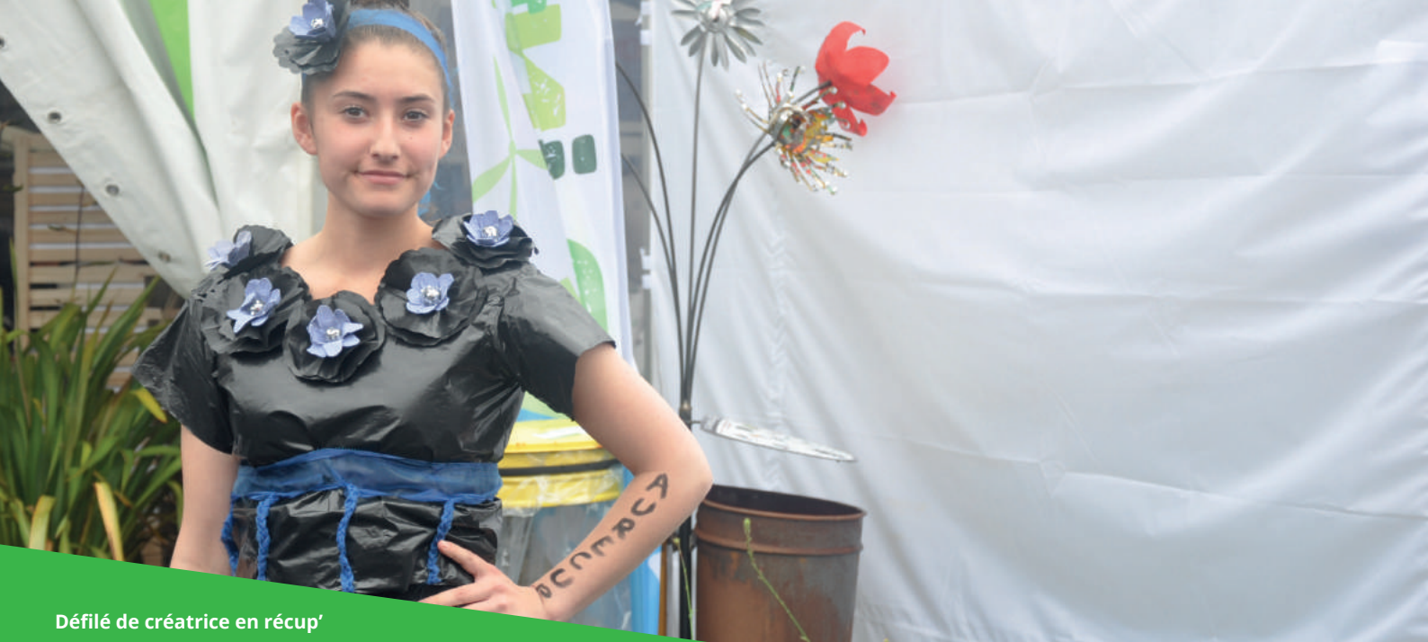
Défilé de créatrice en récup'