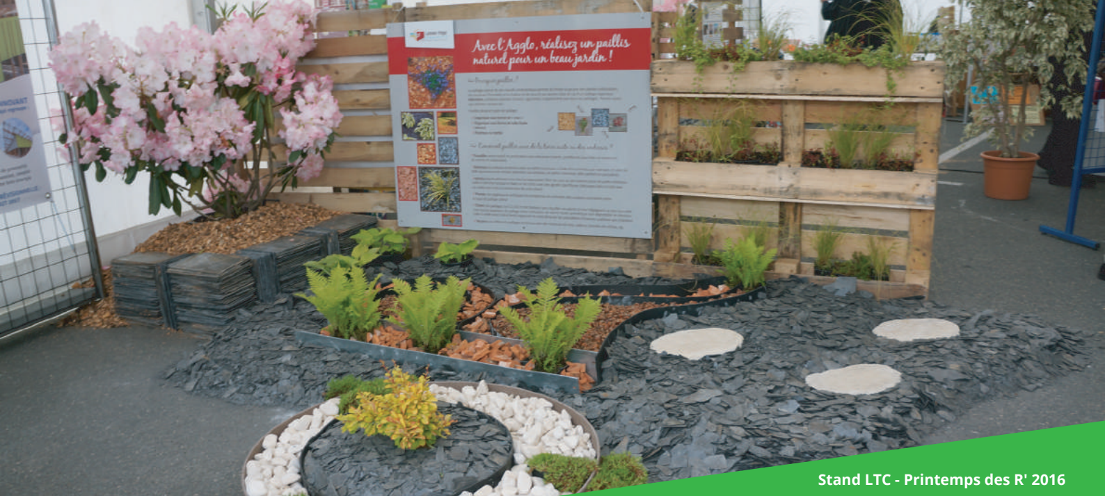
Stand LTC - Printemps des R' 2016