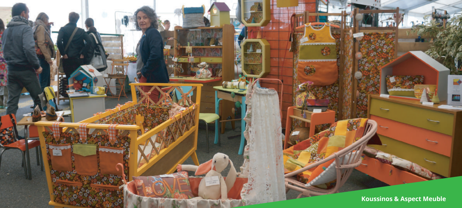
Koussinos & Aspect Meuble