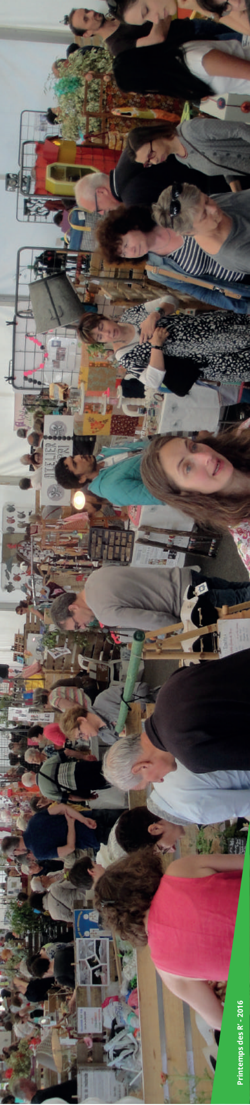
Printemps des R' - 2016