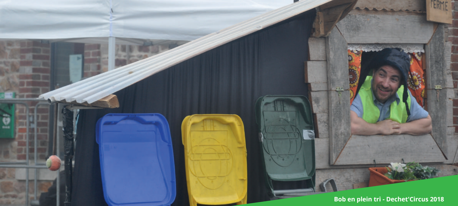
Bob en plein tri - Dechet'Circus 2018