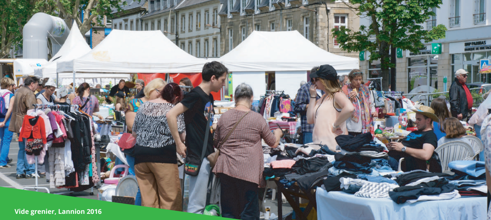
Vide grenier, Lannion 2016