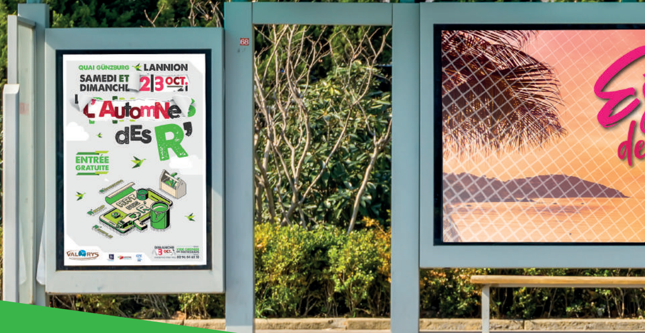
Affiche de la 3 ème édition